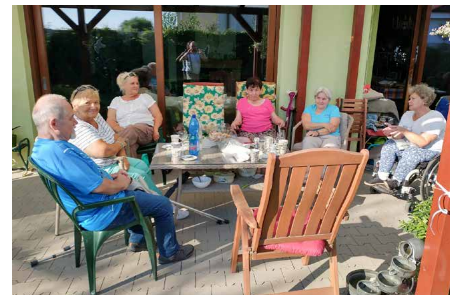
Posedenie v nádhernom prostredí pred hotelom Slovakia a Krym