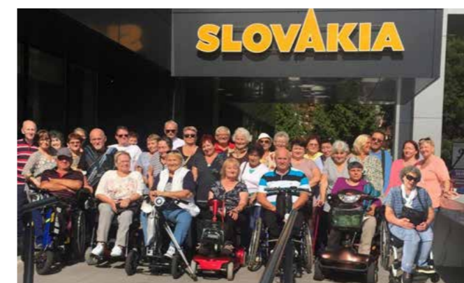
Vo vynovenom hoteli Slovakia Trenčianske Teplice

dobro sa človeku hovorí, keď vidí dosiahnuté vytýčené ciele, spokojných (aj menej spokojných) priateľov, ktorí sa snažia zúčastňovať našich podujatí tak, ako im to dovoľuje ich zdravotný stav. Veď za tých 30 rokov už len spomíname, že sme sa narodili v mladších rokoch (len aby sme mohli spomínať na mladosť) a nepripúšťali sme si svoj skutočne krásny vek. Tu je potrebné poďakovať sa za podporu všetkým našim členom i priaznivcom, rodinným príslušníkom, s ktorými sa delíme o svoje radosti i starosti.