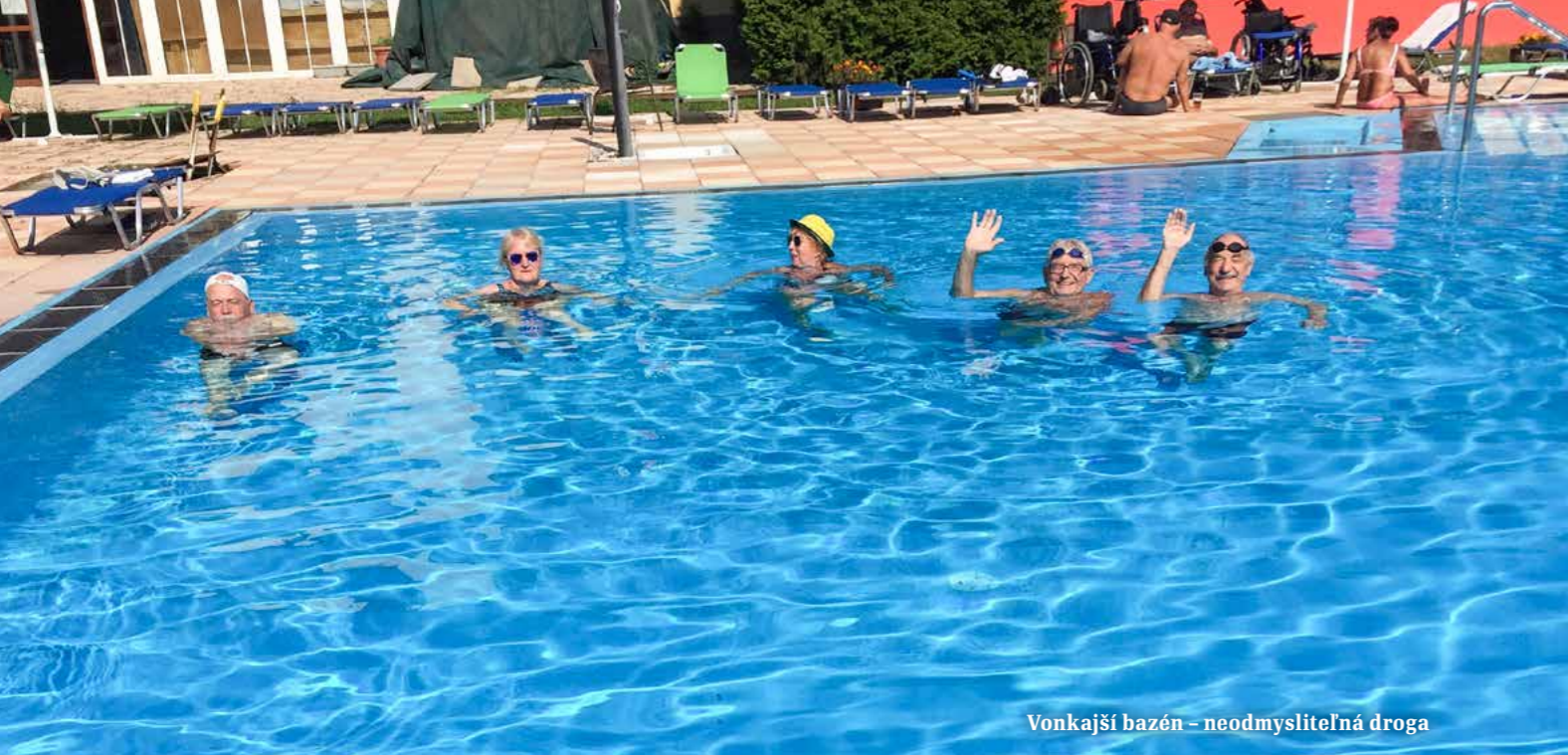
Vonkajší bazén – neodmysliteľná droga