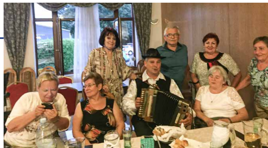
Kačacie hody s kultúrnym programom

N aša RŠO SZTP Asociácia polio v SR aj napriek ťažkým protipandemicným opatreniam, ktoré nám neumožnili v roku 2020 uskutočniť plánované rekondičné pobyty, si to vynahradiť v roku 2021. Aj prvý polrok 2021 bol veľmi nepredvídávavý v tom, ako nás ešte protipandemicke opatrenia v našich plánoch obmedzia. Nevzdávali sme sa. Uskutočnili sa tri vydarené týždenné rekondičné pobyty. Prvý bol v hoteli Hviezda Dudince (aj keď sa termín od mája 2020 4x presúval) od 20. do 27. júna 2021, druhý v hoteli Park Hokovce od 8. do 15. augusta 2021 a tretí v hoteli Slovakia Trenčianske Teplice od 12. do 18. septembra 2021. Aj napriek chaotickým a veľmi prísny