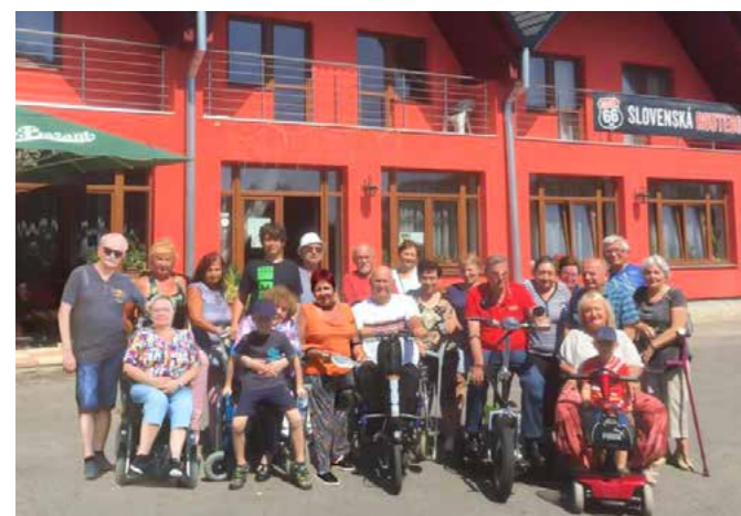
Tu sme pred hotelom Park Hokovce v plnej paráde