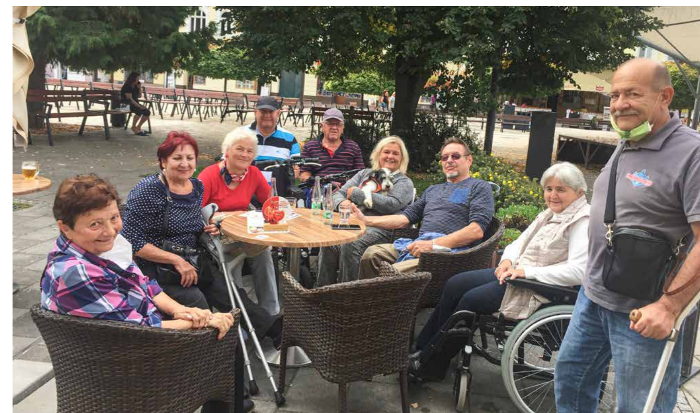
A takto sa stretávame ako jedná rodina